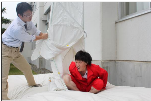
【救助袋を使用しての訓練】