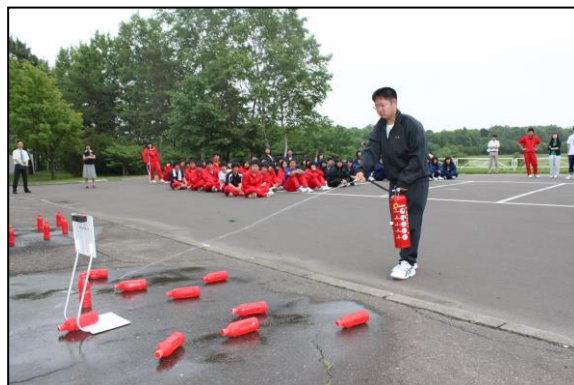
【水消火器を使用しての消火訓練】