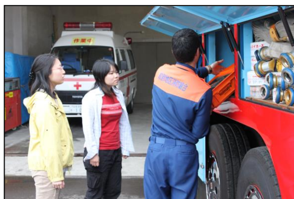
【消防車積載品の説明】