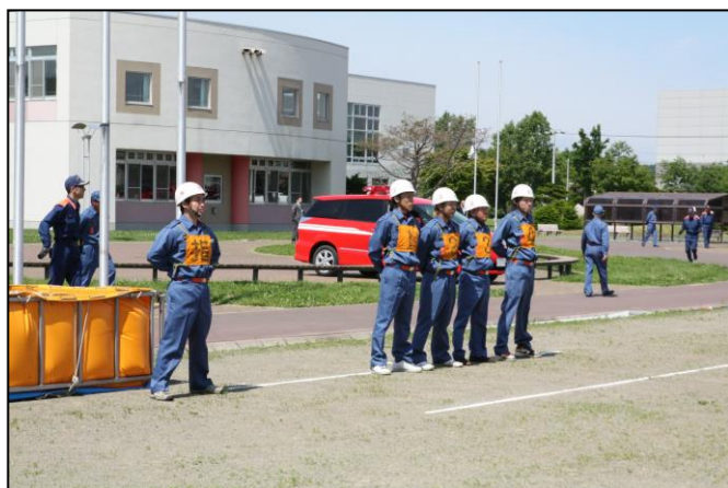
ポンプ車操法訓練