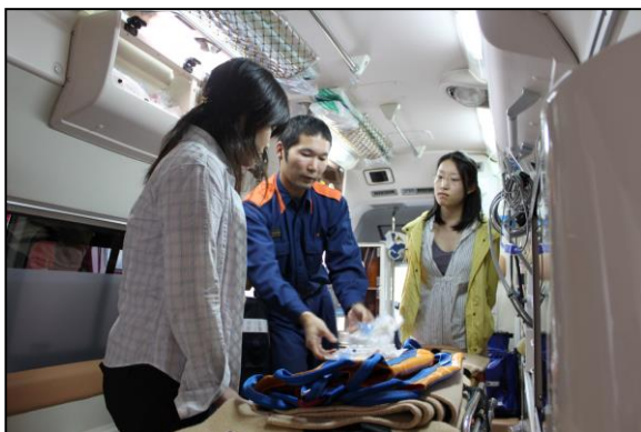
【救急車積載品の説明】