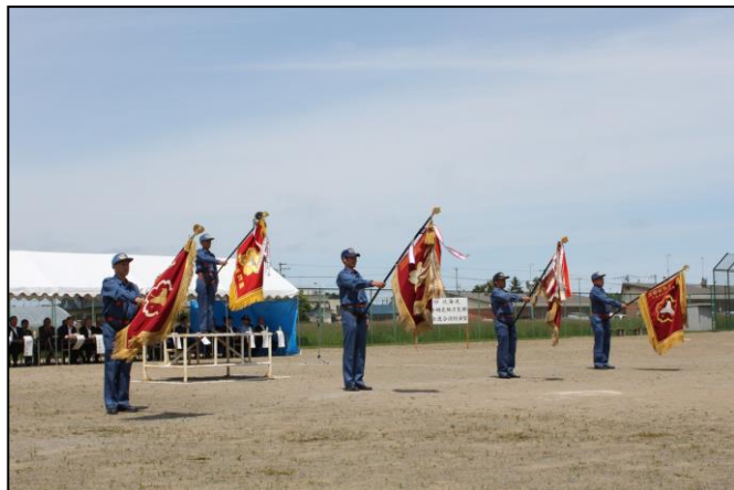
5消防団の団旗が勢揃い

来賓や町民が見守る中、一糸乱れぬ小隊訓練や、実際の消火活動さながらの一斉放水、ポンプ車操法訓練などが行われました。