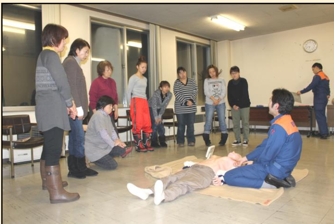
【胸骨圧迫についての説明】