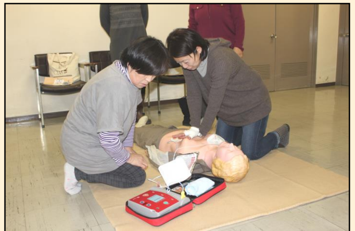
【2人1組での想定訓練】