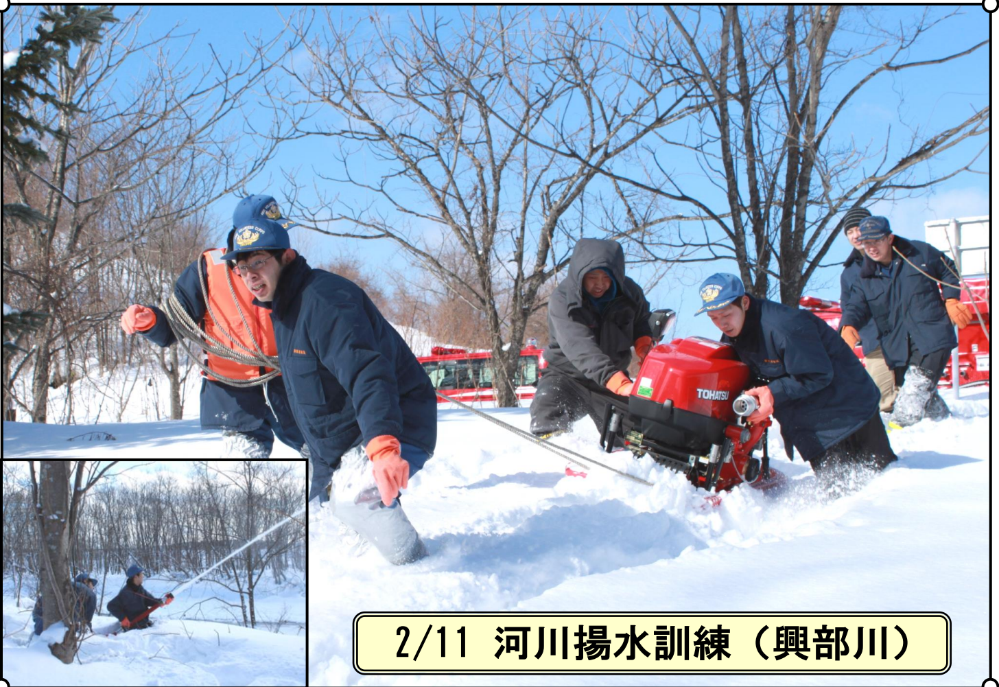
2/11 河川揚水訓練（興部川）