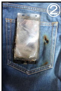
スマートフォンと ズボンの焼損状況