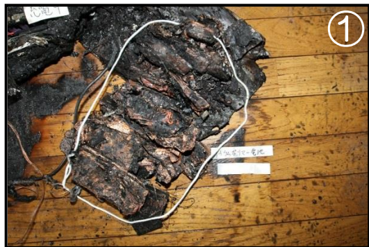
電動アシスト自転車用 電池の焼損状況