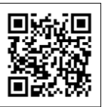
(申し込みフォーム)

■お申込み・お問合せ 福祉保健課 健康推進係 Tel82-4170 申し込みフォーム https://x.gd/f5dCm