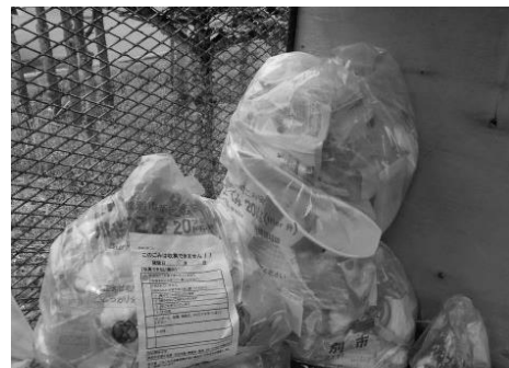
紋別市の指定ゴミ袋で排出