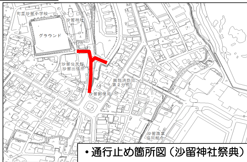
・通行止め箇所図(沙留神社祭典)