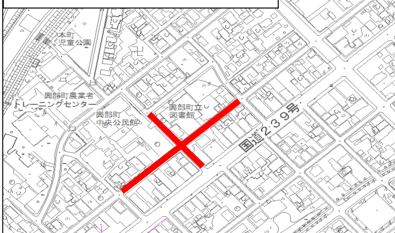
・通行止め箇所図(興部神社祭典)