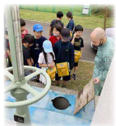
4年生 下水処理場見学