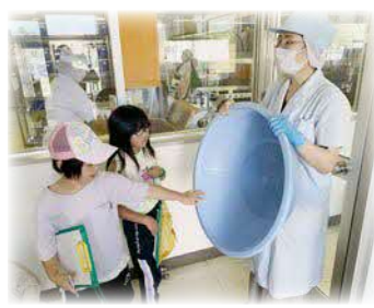
2年生 給食センター見学