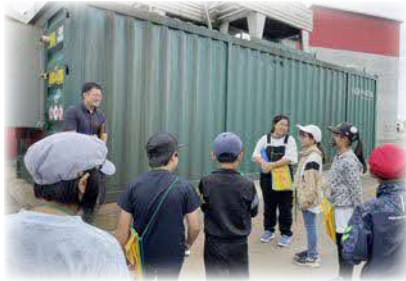
全学年 バイオマス学習 毎年行っていたバイオマス学習。今年度は3～6年生までが施設の見学をしました。

子どもたちの学びの場は、学校・家庭・地域、社会教育施設など多様です。本校では、地域の様々な施設や人々の協力を得て、各教科や総合的な学習の時間、行事などで教育効果を高めています。子どもたちは、実際に見る、聞く、触れる、関わる、体験するといった活動を通して、理解を深めたり感性を磨いたりすることができます。今回の学校紹介では、今年度の取組からいくつかの活動を写真で紹介します。