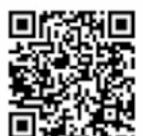
X (旧 Twitter)