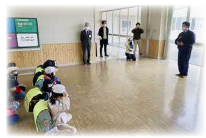
1年生 警察官と一緒に集団下校