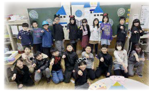
全校「興小祭り」 3～6年がグループごとにお店を企画して互いに楽しむ行事。異世代と交流する貴重な機会となりました。今年度は長寿大学の方に来ていただき、お店を出していただきました。