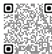
地方税お支払サイト QRコード