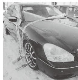
写真は自動車 差押えの一例です