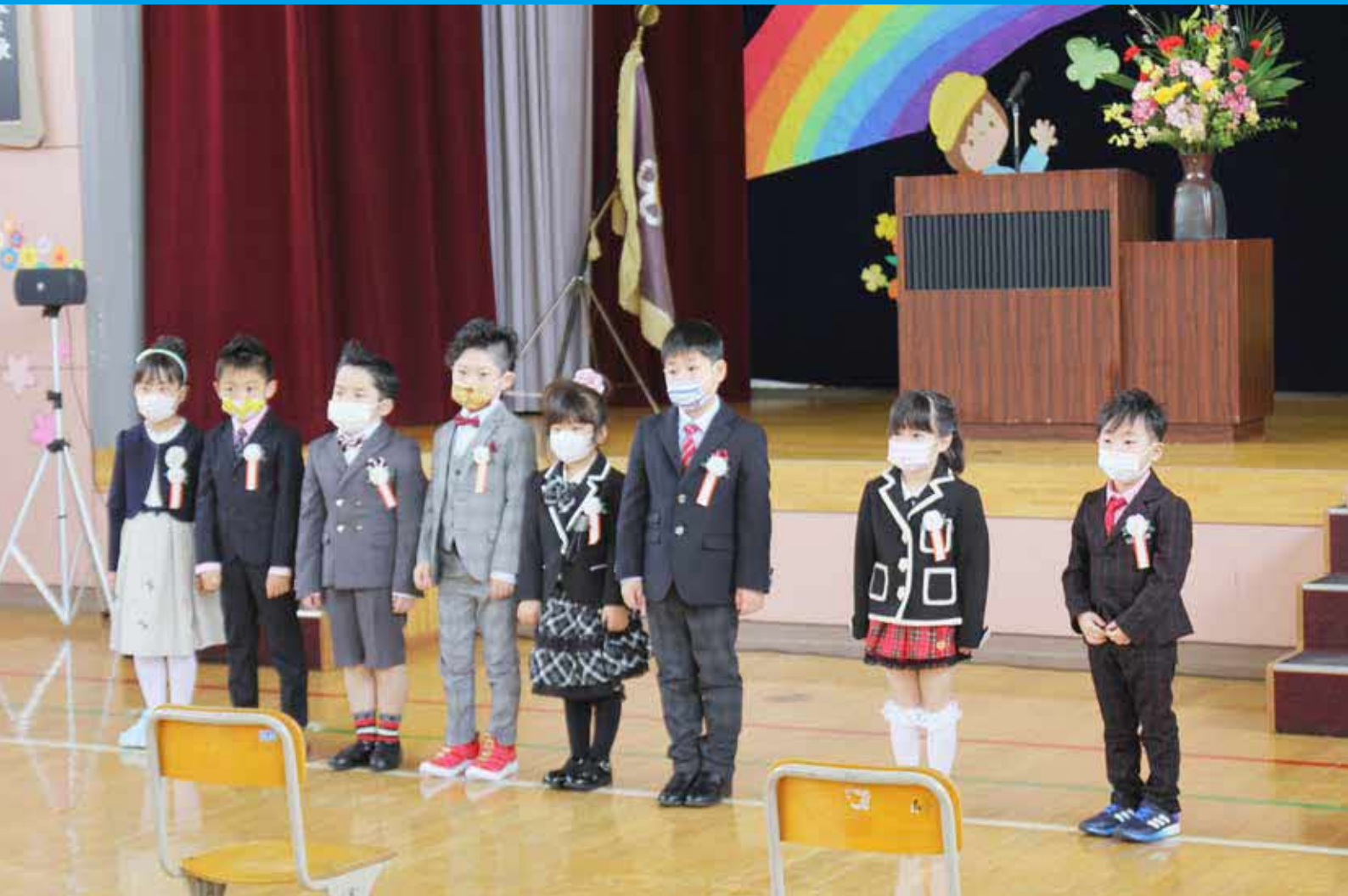
沙留小学校入学式

発行／☎098-1692紋別郡興部町旭町興部町議会 TEL (0158) 82-2135 編集／議会広報特別委員会 FAX (0158) 82-2990