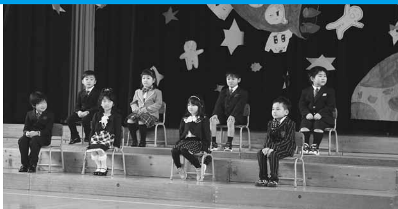
沙留小学校入学式