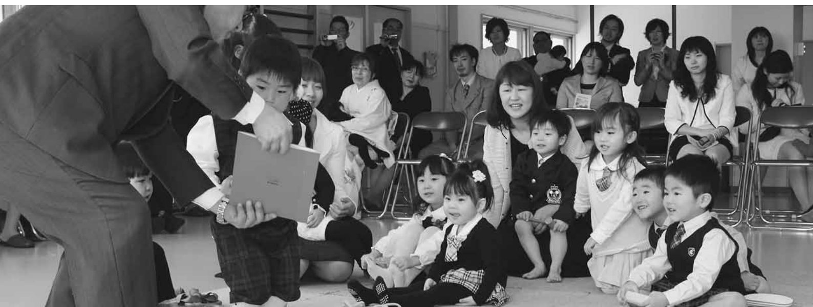
はまなす幼稚園入園式