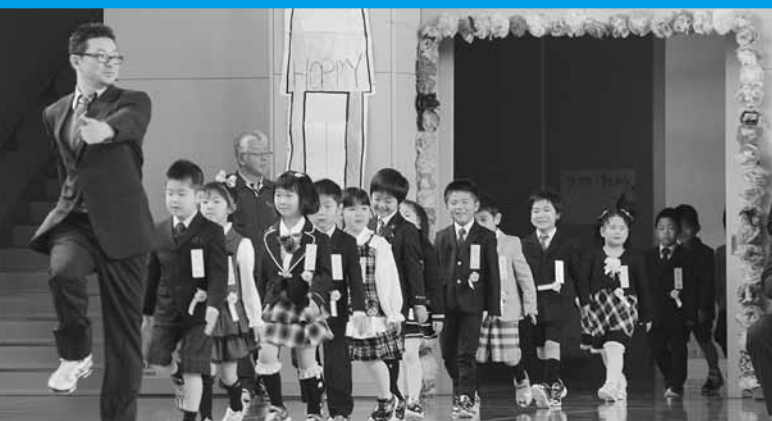
興部小学校入学式