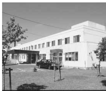
国民健康保険病院

○国保病院事業会計負担金 1000万円増 会計決算見込みにより、病院経営安定化のため