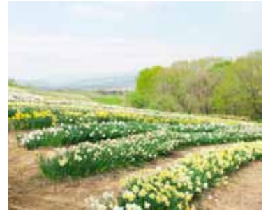
色鮮やかなスイセン

問 きれいに花を植えてい るが、緑ヶ丘の遊歩道 の雑木林があり街から見えな いので、伐採することはでき ないのか。