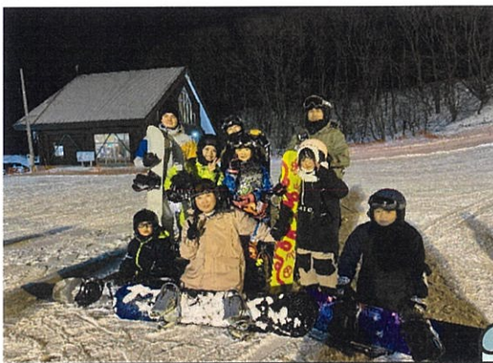
おつかれさまでした!