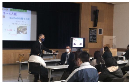
4人グループになり1人の人を褒めるゲームもしました！