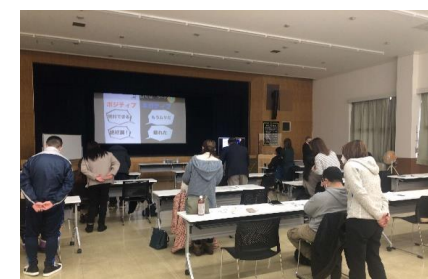
隣の席の人の後ろから、ネガティブな声をかけ、どんな気持ちになるかを試しました。