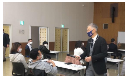
先生から質問が出されそれを隣の人と考えるというのをしました。