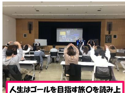
人生はゴールを目指す旅〇を読み上げながらポーズをしています！