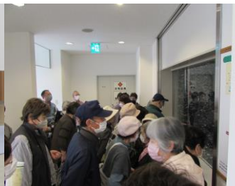
ゴミ処理センター見学