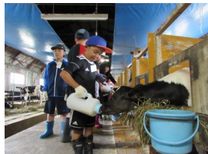
(昨年度 酪農体験のようす)