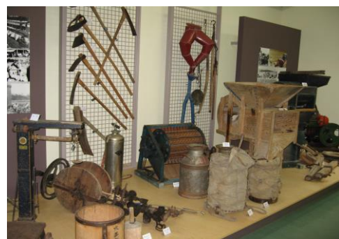
<貴重な資料がいっぱいの資料館>