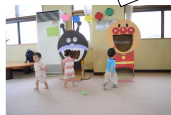
(2017 おこピヨ祭りより)