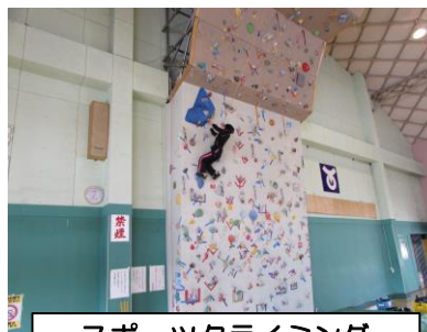
スポーツクライミング

体育振興係では、本誌や広報チラシ等で随時スポーツ事業や教室の参加者を募集しています。難しい技術や特別な道具が必要なことはほとんどありませんし、参加料もあまりかからないものばかりですので、ご家族・お友達などお誘いあわせのうえ、ぜひご参加ください♪ スポーツ教室の希望なども随時受け付けておりますので、お気軽にご相談ください!