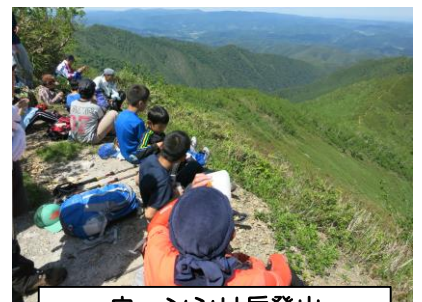
ウェンシリ岳登山