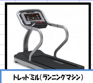
トレッドミル(ランニングマシン)