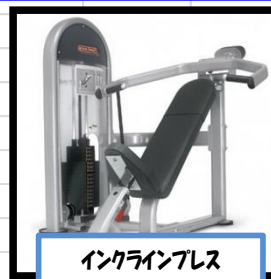
インクラインプレス

農業者トレーニングセンターに新しいトレーニング機器が設置されましたので是非おためしください♪ インクラインプレスは大胸筋や三角筋、上腕二頭筋などが鍛えられ、ゴルフや野球のスイングの強化、肩こりの解消、ハストアップ、二の腕の引き締め効果などが期待できます。