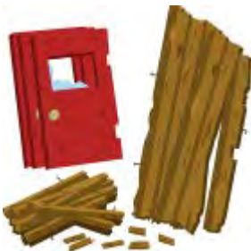
大きな端材（3m以内に切断し できるだけ持ち運べる大きさ） にヒモで束ねる）