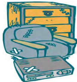
家 具 類