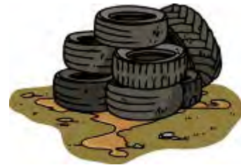
乗用車のタイヤ（4本一組を ひもでしばる）