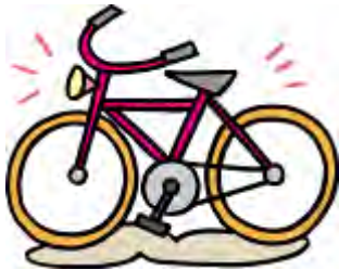
自 転 車

粗大ごみについては、「燃やすごみ・燃やさないごみ袋」（指定有料袋）に入らないものを処分するときに貼って出してください。（長いものは3m以内（できるだけ持ち運べる大きさ）に切断し、ひもで束ね、重さ大人2人で運べる程度のもの）