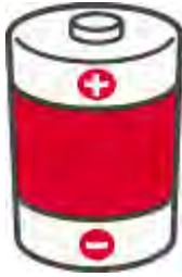
電池 (ボタン電池含む)

※有害ごみの指定袋について 現在、薄青色の指定袋ですが、以前使用の薄赤色の指定袋でも排出可。