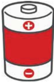
電池（ボタン電池含む）

※有害ごみの指定袋について 現在、薄青色の指定袋ですが、以前 使用の薄赤色の指定袋でも排出可