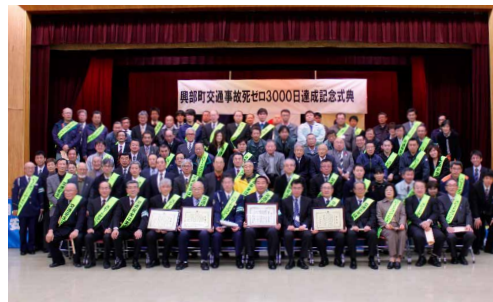
交通事故死ゼロ 3000 日達成記念式典

興部町内における交通事故死ゼロの記録が、平成27年11月2日、3000日に達したことを記念し、11月11日興部町中央公民館にて「興部町交通事故死ゼロ3000日達成記念式典」を挙行しました。交通事故死ゼロ3000日の達成は、町民の皆様をはじめ、町内自治会、各事業所・関係機関が、日頃より交通安全に真摯に取り組まれた成果であり、心より感謝いたします。今後、まずは「交通事故死ゼロ3500日」を