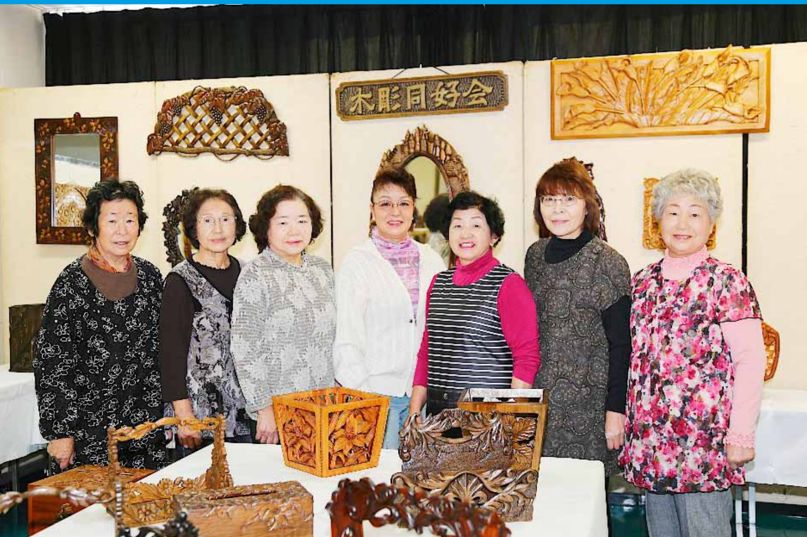
レディースきちきち