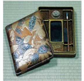
柳原伯爵より贈られた硯箱